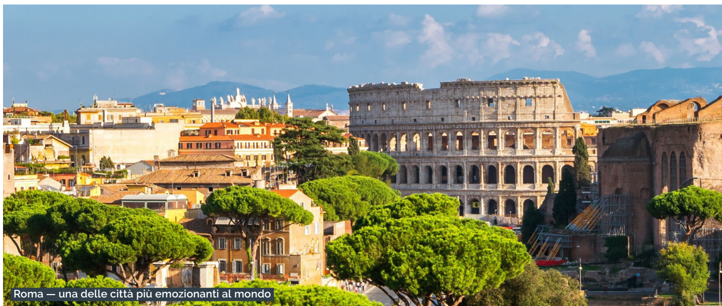
Roma — una delle città più emozionanti al mondo