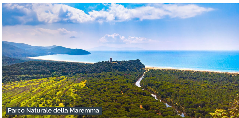
Parco Naturale della Maremma