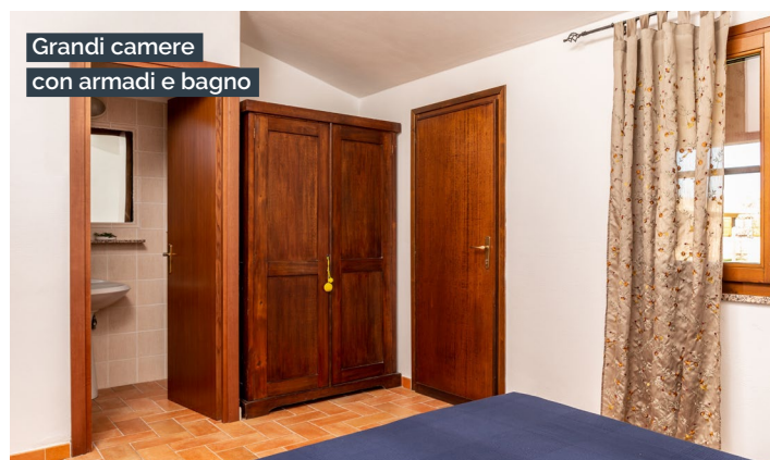
Grandi camere con armadi e bagno