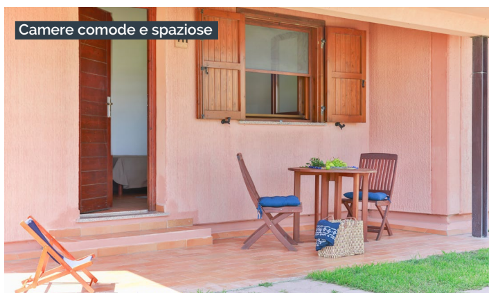
Camere comode e spaziose