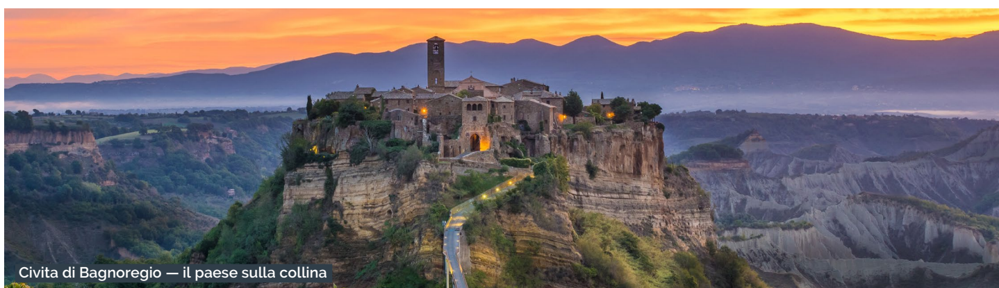
Civita di Bagnoregio — il paese sulla collina