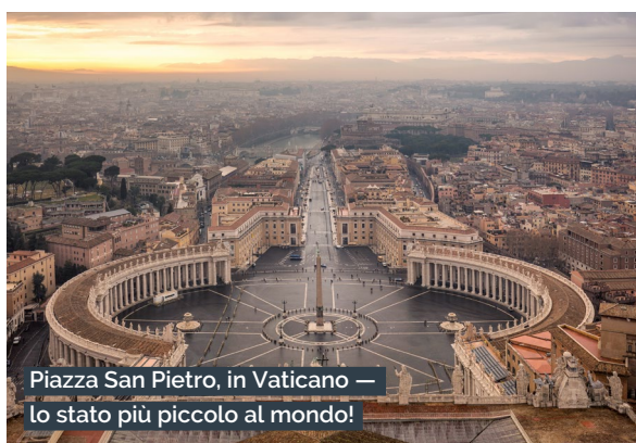
Piazza San Pietro, in Vaticano — lo stato più piccolo al mondo!